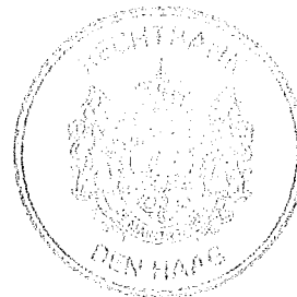
Team Kanton Den Haag

BE(DH) Rolnr 4006928/15-9589 13 augustus 2015