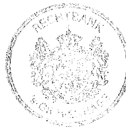
Sector kanton, locatie 's-Gravenhage